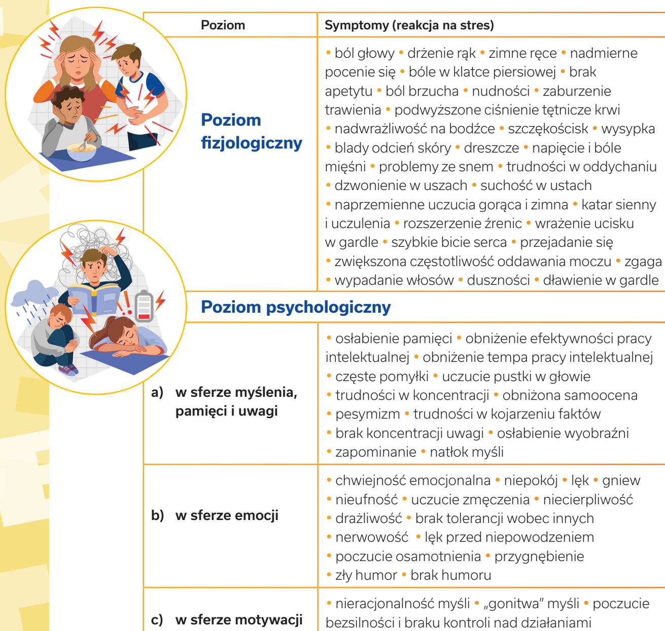
Tabela 1. Reakcja na stres egzaminacyjny

Warunkiem radzenia sobie ze stresem egzaminacyjnym jest umiejętność szybkiego rozpoznawania niepokojących symptomów, rozumienia ich i zmieniania tego, co zagrażające. Twoim zadaniem jest pomóc dziecku w ich rozpoznawaniu, wówczas łatwiej mu będzie nauczyć się kontrolowania sytuacji stresującej i szybkiego rozładowywania napięcia. Wiedza o symptomach stresu umożliwi nam znalezienie skutecznych strategii i metod radzenia sobie z każdym typem stresu egzaminacyjnego.